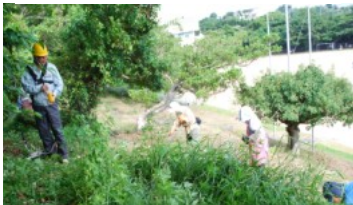
コザ小学校校内の清掃・草刈ボランティア活動 ( 昨年9月 )