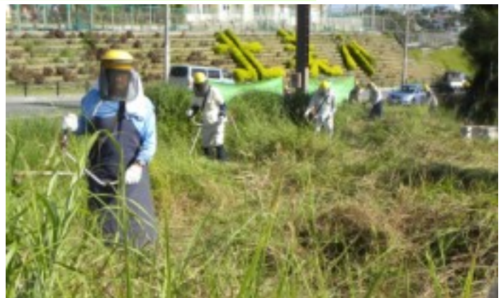
「おきなわ長寿苑」の駐車場の草刈ボランティア ( 昨年10月 )