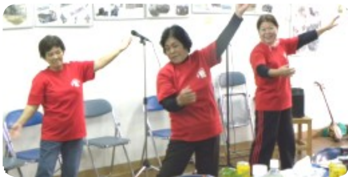
弁当班グループによる「大阪しぐれ」「フェレマンボ」の踊り(上)と締めのカチャーシー(下)