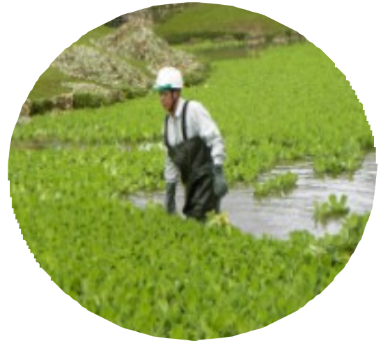
腰まで浸かって職員が岸辺まで押し運ぶ