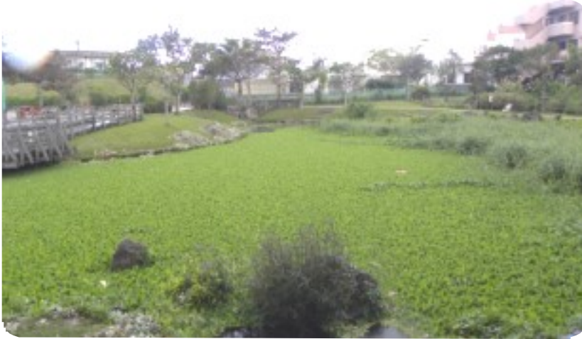
池を埋め尽くした浮草で陸地との境界がわからず危険な状態

毎年この時期に行われる“浮草”除去作業が12月18日、白川街区公園で行われた。池の面積は503㎡、水深は深いところで120cmあり、6人の職員が腰まで浸かっての作業。一日がかりの作業できれいに除去され、小魚がスイスイ気持ちよさそうに泳いでいた。