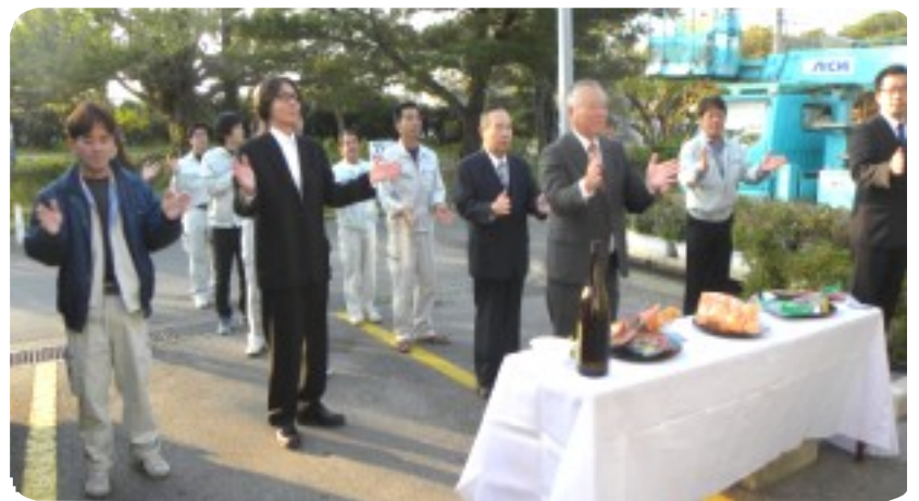
公園事務所では8時15分から役員職員、公園関係者と就業会員が公園利用者の安全と、会員の無事故を祈願。