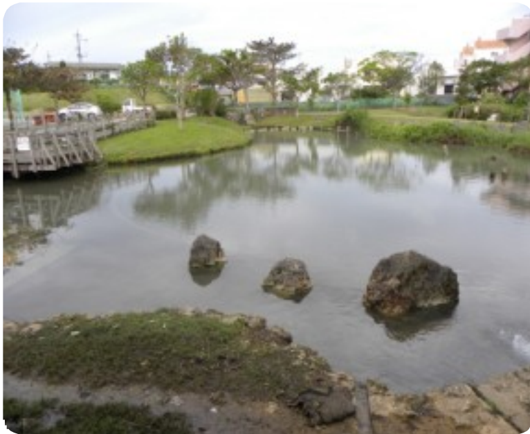
池は見事に蘇り、小魚が気持ちよさそうにスイスイ