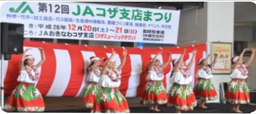
ステージでは民謡、演芸、踊り等多彩な出し物が人気を呼んだ

当センターも就業機会開拓推進員による相談コーナーを設置、パソコン講師の「パソコン教室」PR、地元地区会員による普及啓発用チラシ配布等に参加した。