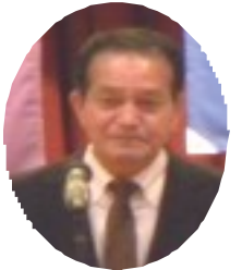
沖縄市 副市長 仲本 兼明 様