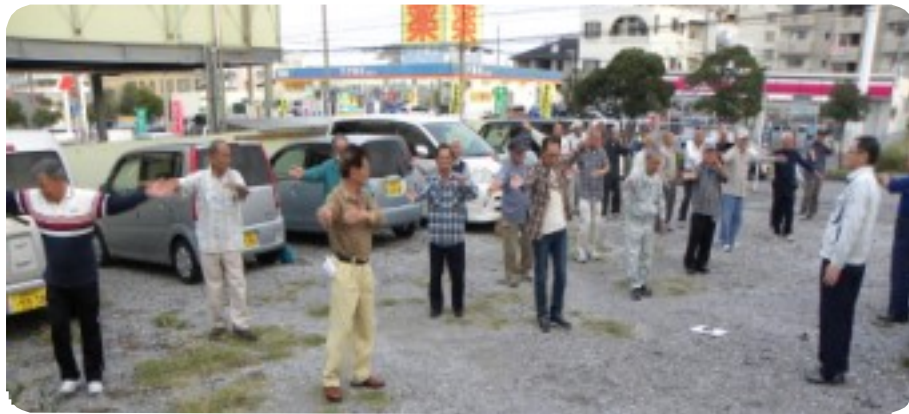
実地研修で手や足の動きを学ぶ参加者

「あなたに会えて嬉しい」「あなたをもてなします」という気持ちを込めることで自然と笑顔になります。