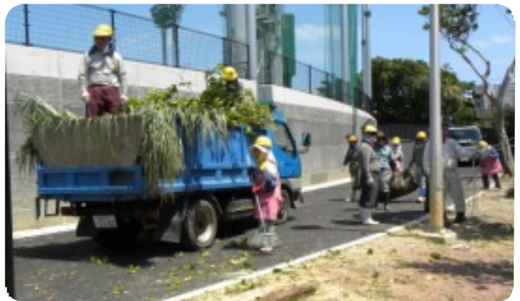
「公園利用者からの“ご苦労さま。”の言葉がとてもうれしい」と就業会員は話してくれた。