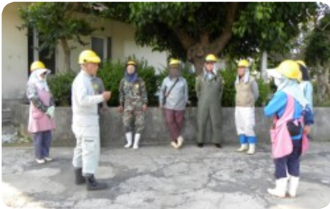
朝のミーティングは8時前から。今日の作業スケジュールを発表、就業前の器具の点検、利用者の安全確保最優先をお互いに確認し合う。