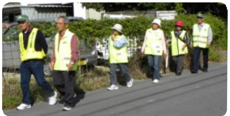
パトロールは児童を事件・事故から守るだけでなく、保護者の安心、安全の向上と明るい地域づくりに大きく貢献しています。