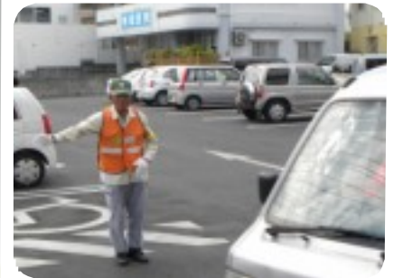
お客様の安全が第1、言葉遣いと笑顔で明るく案内しています