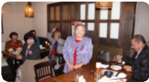
今年の抱負や夢を楽しそうに話す参加者

う。発生状況を時間別で見ると午前は7時～9時、午後は3時～7時の間に多発している。発生場所は表・裏通りとも住宅街での発生が多く見られる。主な事案内容は「ゲームをあげるよ」「あめ玉あげるよ」「一緒にどこか行こう」などの他、「携帯電話でスカートの中を盗撮」等性にまつわる事案が多いという。各地区で行っている下校時安全パトロールは児童を事件・事故から守るだけではなく、保護者の安心、安全の向上に繋がりを、明るい地域づくりに大きく貢献しています。今年には更に参加者が増えることを期待します。