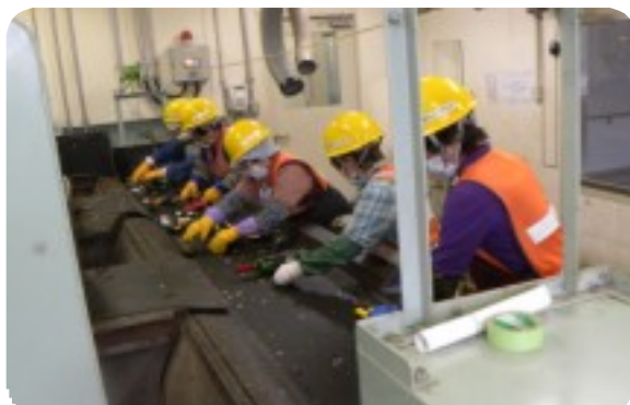
2Fでのピンの選別作業は女性5人が担当しているが、ピンがぶつかり合う音がすさまじく耳栓の着用となる