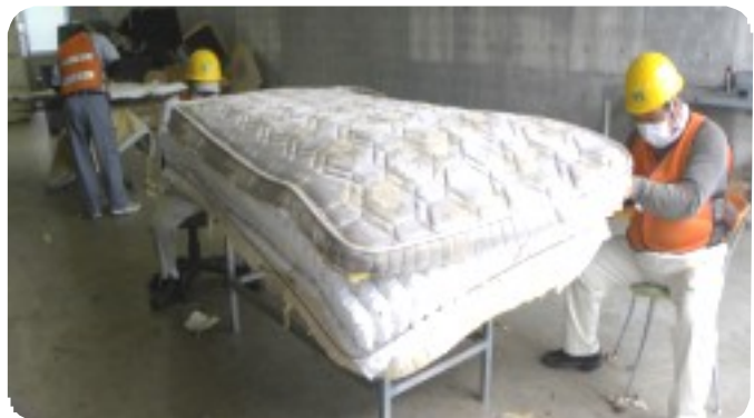
ベット解体では7人が就業、太い金属類を外す作業（写真右）とさらに内部の細い金属外し作業が行われる