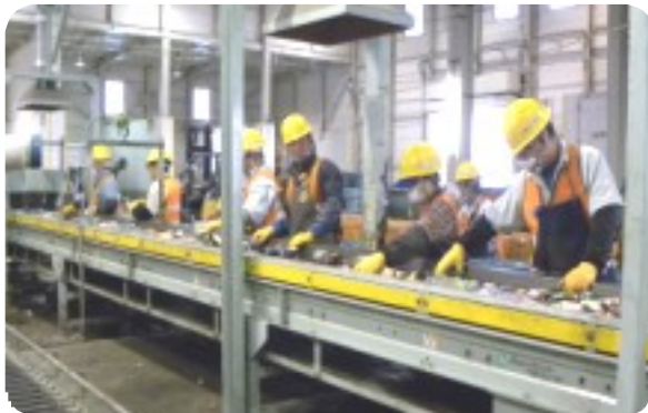
ベルトコンベアで流れてくるピンの選別作業には8人が就業している（1F）