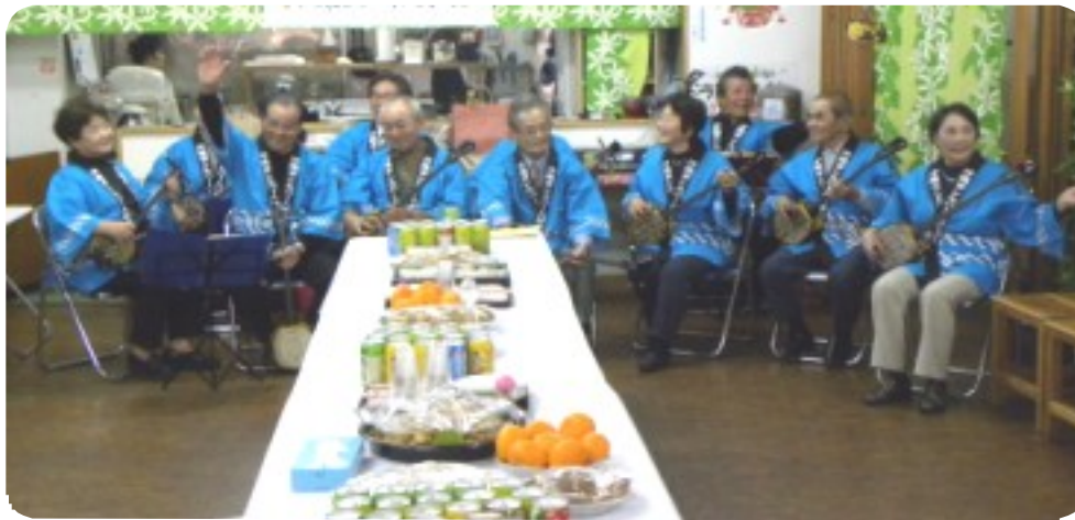
三線同好会による「かぎやで風節」「鶴亀節」で幕開け

発行所 公益社団法人 沖縄市シルバー人材センター 〒904-2155 沖縄市美原 3丁目 1番1号 電話番号 (098) 929-1361 http://www.okinawasisi.com 1月末現在の会員数716人 (男性417人・女性299人)