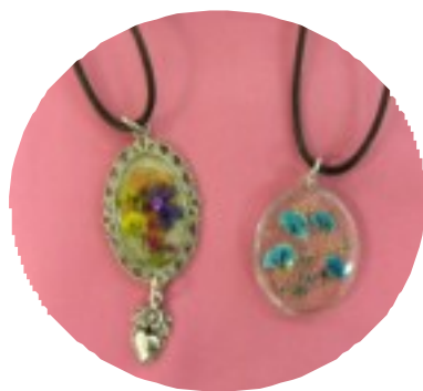
「押し花」でこんな楽しいネックレスができました