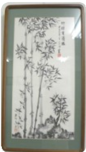
喜瀬守章墨絵展 (6月5日~20日) 作品「竹林」