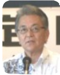
島袋 芳敬 沖縄市 副市長