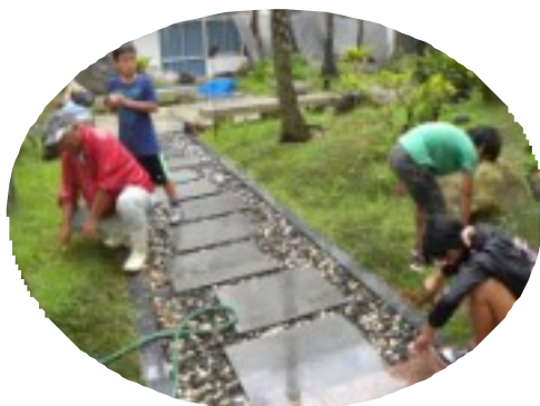
児童たちは会員との草むしり共同作業に皆生き生きとして取り組んでいた。