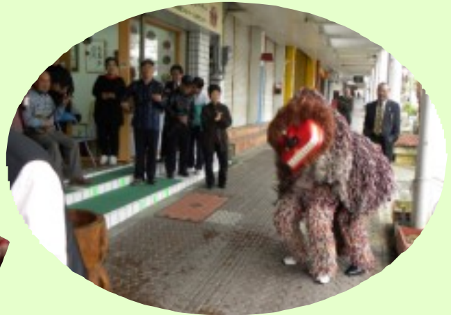
厄病退治や悪魔払いをして幸せを招く獅子がゆんたくまちやの前で華麗な舞を披露