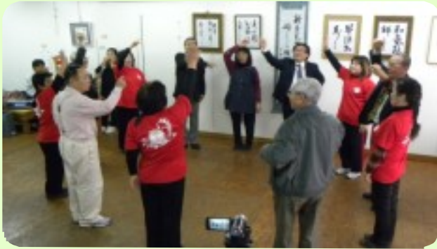
弁当班メンバーの楽しいダンスに参加者もノリノリ...