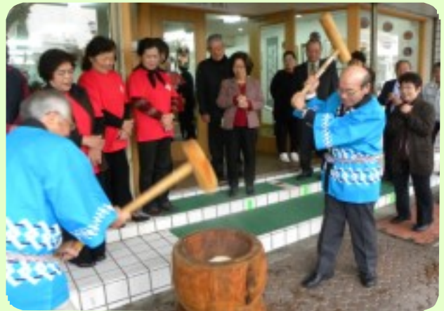
力強い餅つきでセンターの発展、ゆんたくまちやの商売繁盛、無事故を祈願。おしるこを作って全員にふるまった