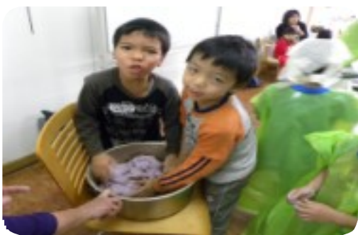
1月19日のカーサマーチ作り には11人の可愛い子どもたちが 果敢に挑戦