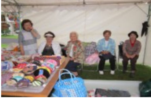
手工芸同好会の仲間たち ＝ 沖縄市福祉まつり ＝