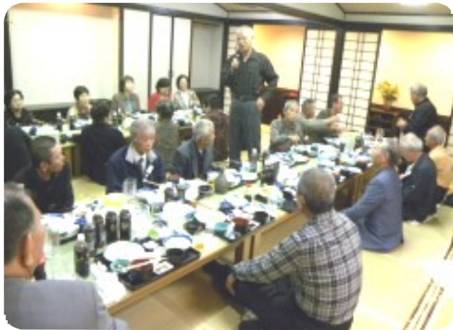
おいしい料理に舌鼓を打ちながら今年の出来事、来年の楽しい夢を語る参加者