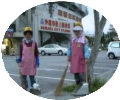
早朝からの清掃に公園利用者からも温かい声がかかる (11月14日午前6時30分)