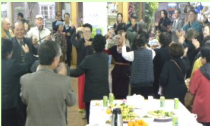
締めはやはり“カチャーシー”