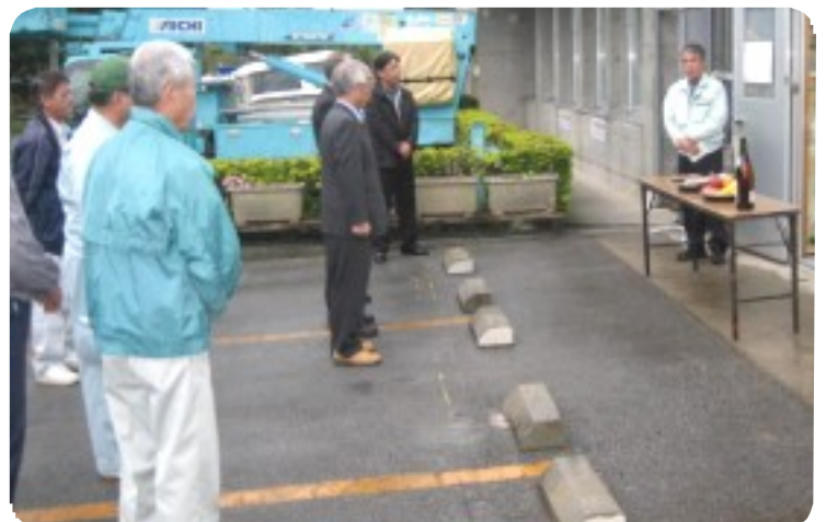
公園事務所では、8時から公園利用者と就業会員の安全を祈念して「安全祈願祭」を行った。