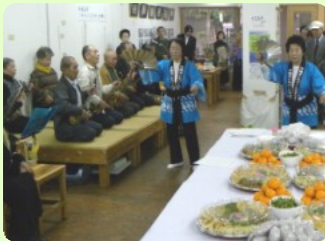
琉舞同好会による舞い