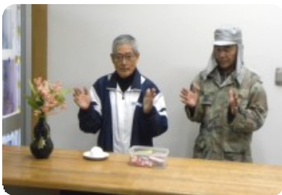
美里公園では、公園利用者と就業会員の安全を祈願した。