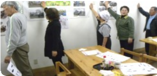
肩周辺の筋肉をほぐし、血行を改善しよう 毎日続けてやる事が大切