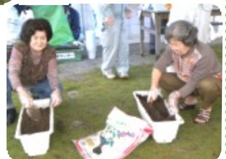
ゆんたくしながらの土作り