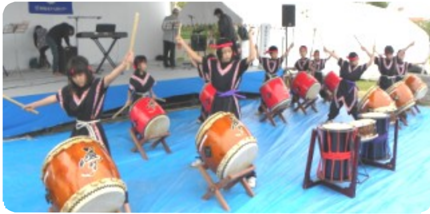
「東松本山岳夢太鼓」の演舞