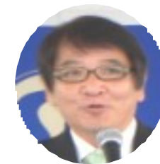
仲宗根 弘 沖縄市議会議員