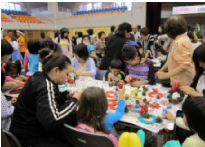
今年も多くの家族づれで賑わったフェア会場