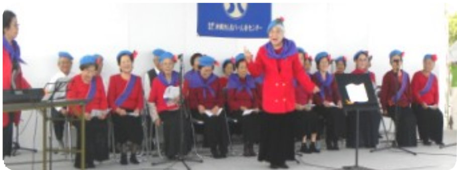
沖縄市老人クラブ連合歌声サークルによる唱歌メンバーの最高齢メンバーの最高齢 御年97歳