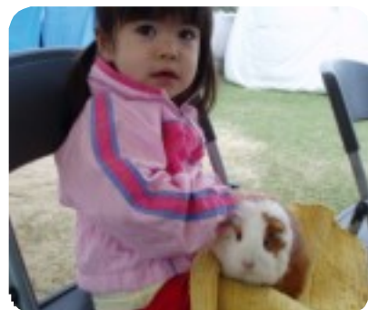
移動動物園のうさぎと遊ぶ子