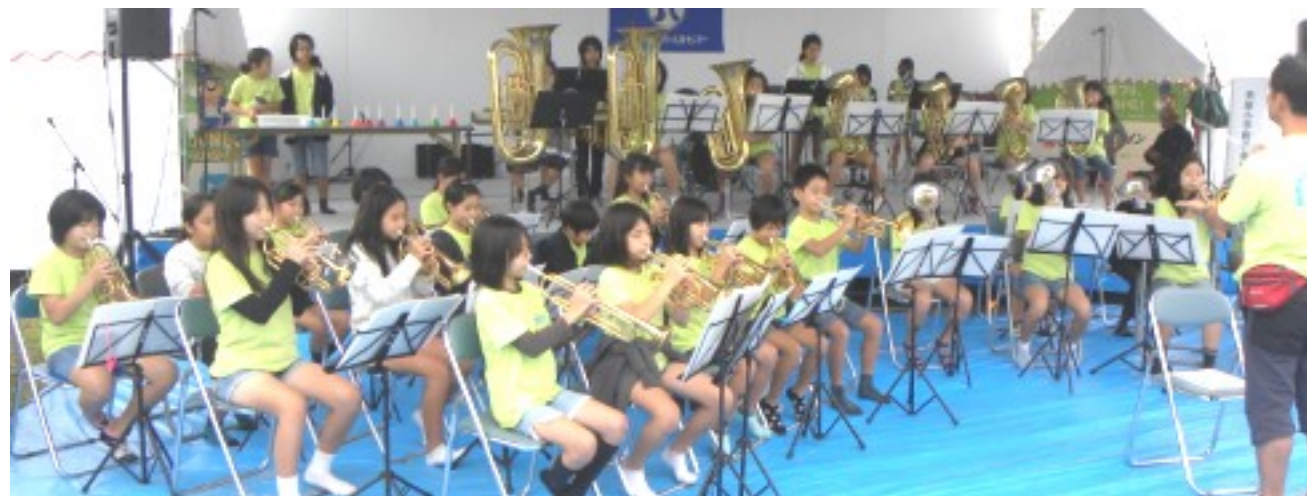
美原小学校吹奏楽の演奏