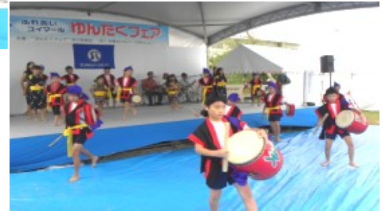
美里こども会の「エイサー」演舞