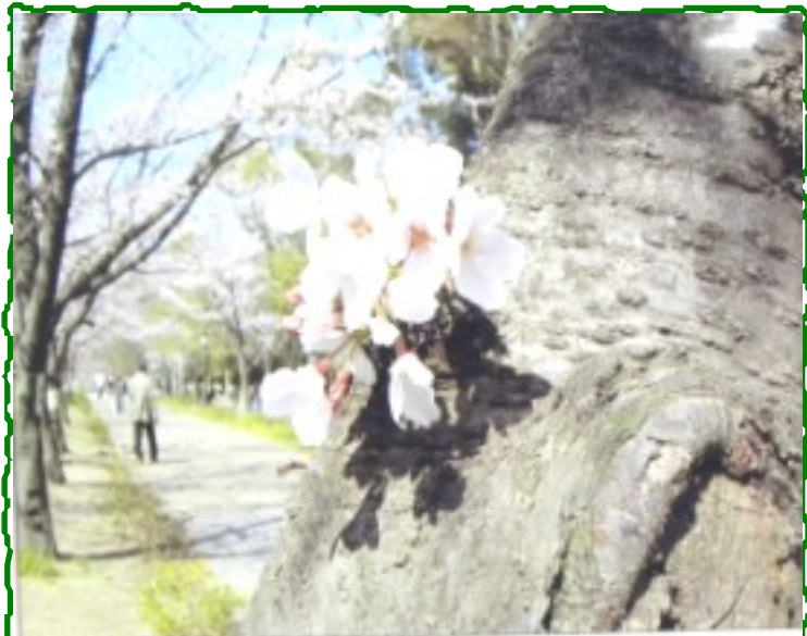
大阪城の桜 大城 光子（コザ中校地区）