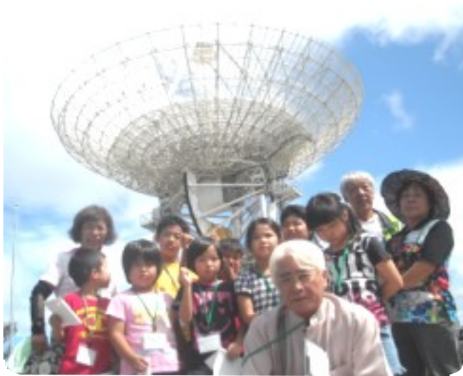
8月10日は、「沖縄宇宙通信所」へ。ここは各種の人工衛星からの電波を受信、常に人工衛星と通信をしています。