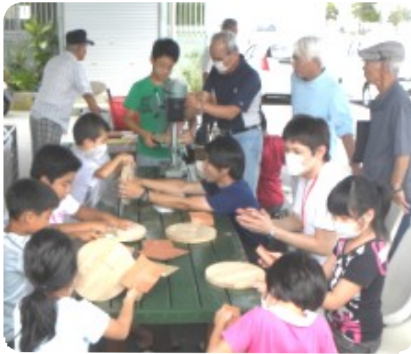
講師の指導のもと、「木工時計」 づくりに熱中するキッズの子供たち =センター事務所前にて=