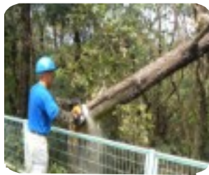
高木樹の折れ枝剪定作業(明道公園にて)