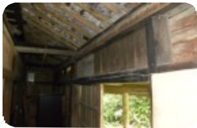
工事前の屋根裏がきれいに甦りました