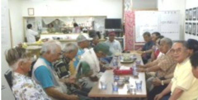
大会終了後は全員で反省会兼懇談会