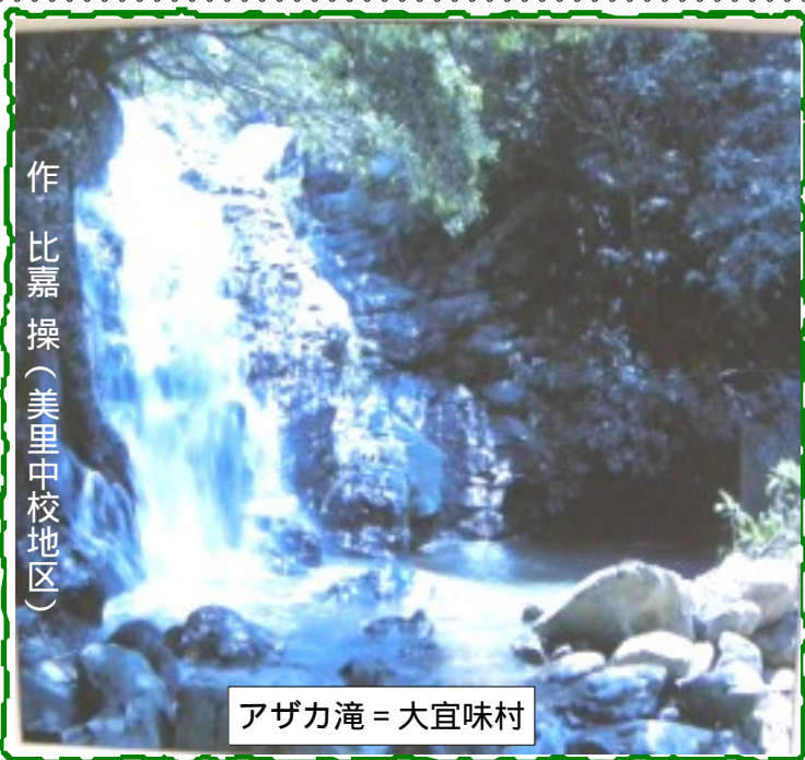
作 比嘉操 (美里中校地区)