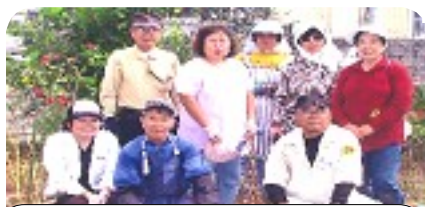
福祉施設での植栽ボランティア