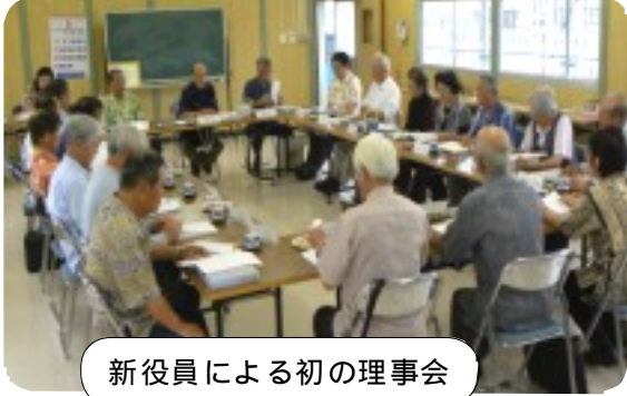
新役員による初の理事会

最後に専門委員会の設置と、総務・広報委員5人、就業委員6人、福祉・家事委員と安全就業委員各7人に理事長より委嘱状が交付された。理事会終了後直ちに各委員会が開催された。(3面に詳細)