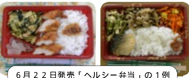
6月22日発売「ヘルシー弁当」の1例

特徴は、肉か魚をメインにし、野菜をふんだんに使って、脂分と塩分を減らした味は家庭料理そのものです。6月9日(水)に行われた試食会(50人参加)でもご飯の量が少ないとの意見もありましたが、味付け、内容については殆どの方から合格点を頂きました。献立では「日替わり」となり、毎日が楽しめる内容となっております。