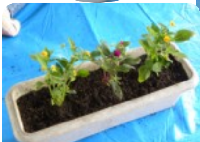
今回は、「メランポジュウム」「マツバボタン」「千日紅」が植えられました