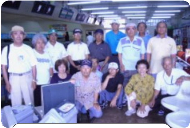
豪華賞品を前に参加者全員で記念撮影