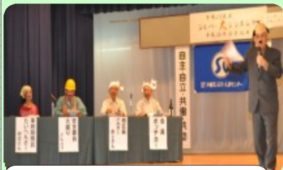
第2部「会員によるディスカッション」

平成21年度「通常総会」が去る3月26日(金)、沖縄市農研センターに於いて開催されました。