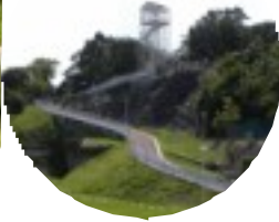
下から見た展望台