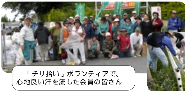
「チリ拾い」ボランティアで、心地良い汗を流した会員の皆さん