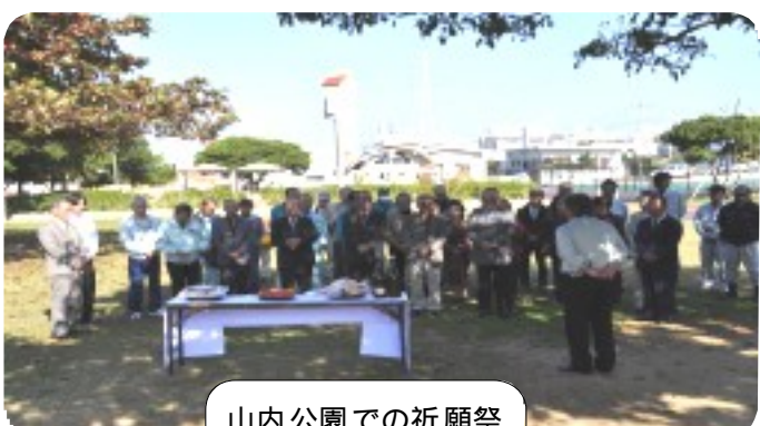
山内公園での祈願祭