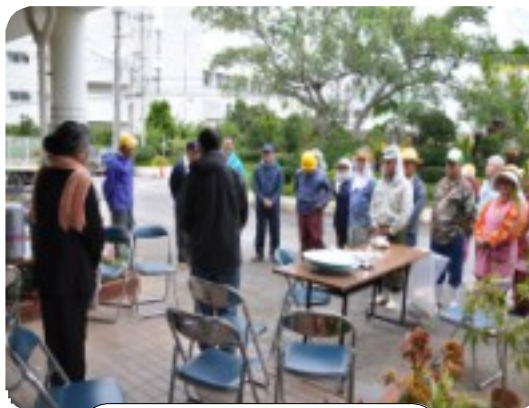
作業前のミーティング