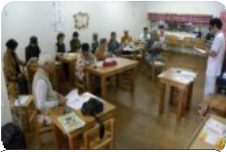
講師の話に真剣に聴きいる参加者

「認知症」の症状は様々で、知的能力の低下、心の症状と行動の障害、日常生活能力の低下、身体の障害等ですが、「認知症」の原因や状態によっては、適切な診断・治療によって、症状が改善する事もあるそうです。出来るだけ早期に発見し、精神科等の病院での受診がお勧めだそうです。