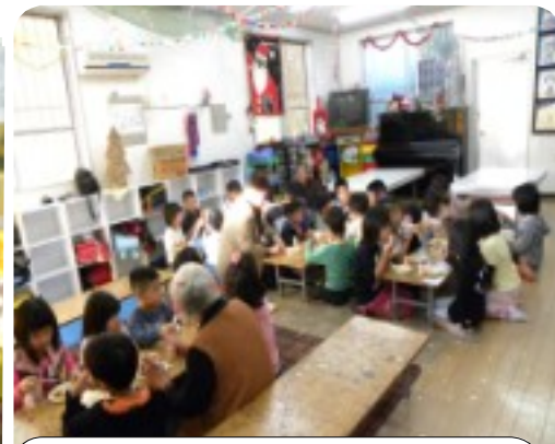
「ゆんたくまちや」製バナナケーキで楽しいクリスマス会

昨年11月からのスタートでしたが、和気あいあいの雰囲気の中で、児童たちもすっかり溶け込んで、楽しんでいました。