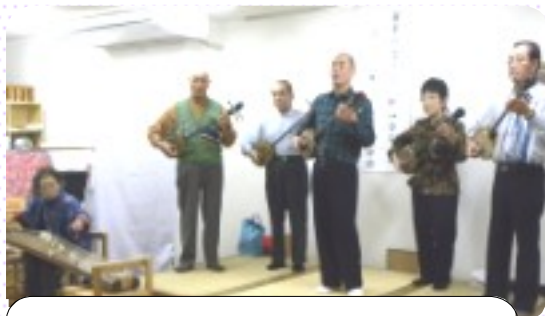
「祝節」「目出度節」「安里屋ユンタ」