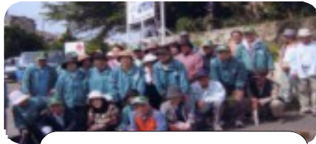
昨年のボランティア参加者