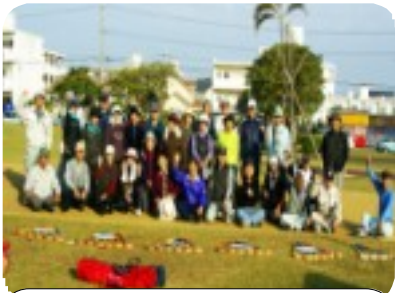
プレーに参加した会員の皆さん