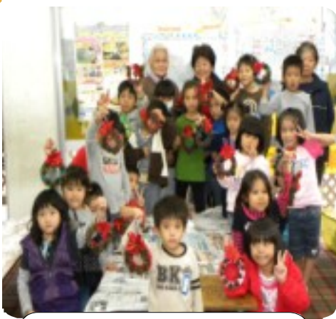
完成した「クリスマスリース」

「オキナワキッズクラブ」では、生徒さんの他、パソコン・英会話・そろばん・習字・ピアノ教室も開設しています。お問い合わせは