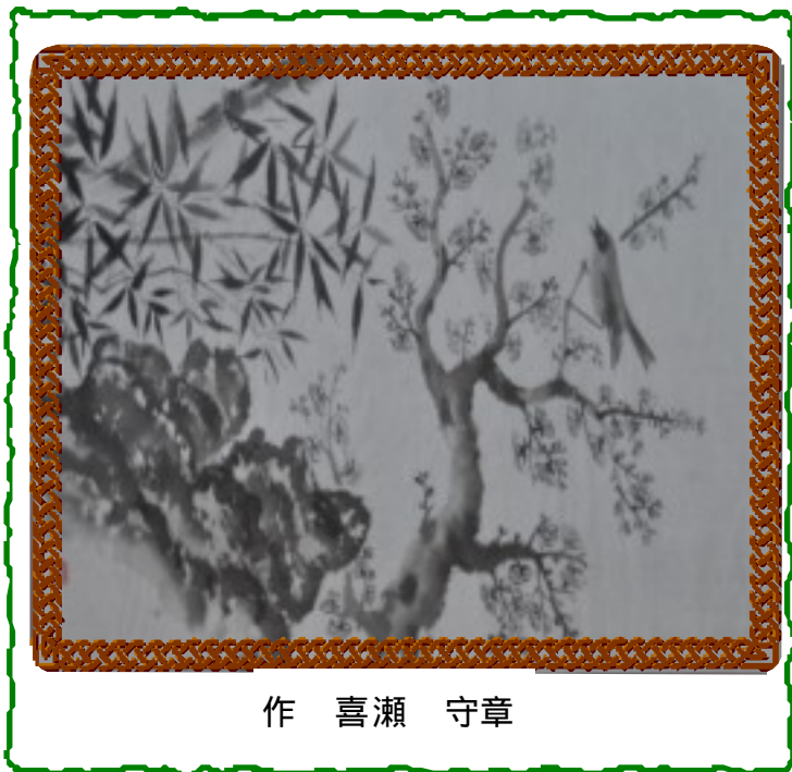
作 喜瀬 守章