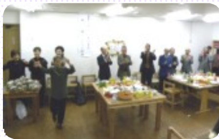
♫はやっぱりカチャーシー