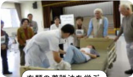
衣類の着脱法を学ぶ