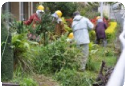
会員によるボランティア活動 「沖縄一条園」にて

この日も朝8時に全員が集合、リーダーを中心にミーティングを行い、早速作業に入り、心地良い汗を流していました。大変お疲れ様でした。