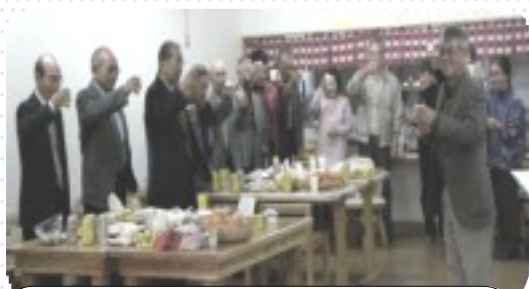
センターの益々の発展に“乾杯！”