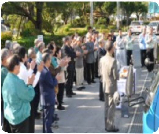
参加者全員で安全祈願