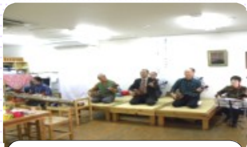
三線同好会「かぎやで風」で幕開