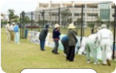
パネル展も大好評