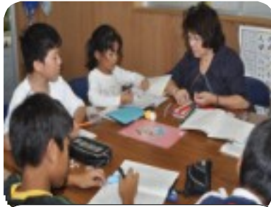
宿題に真剣に取り組む児童

今月は、沖縄市シルバー人材センター独自事業の第2弾、平成18年に開設された「寺小屋キッズ」を紹介します。 現在、先生2人（いずれも元小学校教師）が5人の生徒さんの学習指導に当たっています。親御さんからの評判もよく、生徒たちものびのび明るく元気に通っています。