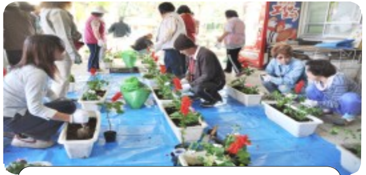
勢いを取り戻した「サルビア」「インパチェンス」