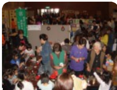
真剣に作業する「ちびっ子たち」

当センターの手工芸同好会が参加、「まつボツクリ」によるクリスマスリース作りを行いました。この催しは毎年好評で、大勢の「ちびっ子」たちで賑わっていますが、出来上がった作品に喜びを表す子ども達の笑顔にいつもの事ながら、癒されます。