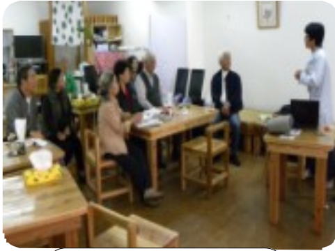
真剣に耳を傾ける参加者