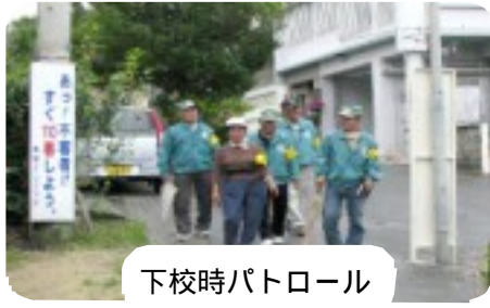
下校時パトロール