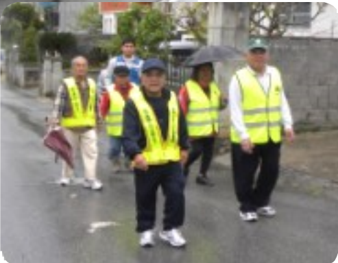
ときどき小雨がぱらつく中、会員と沖縄警察防犯アドバイザー委員と合同で地域内をパトロール