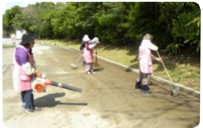
「気持ちよく利用していただきたい」と今日も就業に汗を流すシルバーの仲間たち。