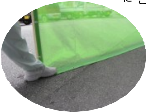
10cmの踏み代を設けて足で抑えることにより小石の飛散を防止する改良型