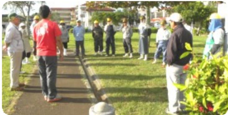
事故原因と再発防止対策について話し合った緊急ミーティング

翌日の27日、 事故現場で グループ全 員による緊 急ミーティ ングを開き、 事故の検証 と併せて事 故防止対策 を話し合った。 その中で、 ネットと地 面間の約15 cmの隙間が 大きな原因 と考えられるこ とから、緊急に 改善を要すと の結論に至った。 現在すでに 改良型ネッ トを製作中 で順次交換す る方向で準備 している。