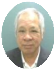
美東・東中校地区

1月24日(日)には、沖縄残波岬ロイヤルホテルでグラウンドゴルフ大会、バイキングでお楽しみいただき、夜は居酒屋「歩つぽや」で新年会を開催します。皆様の参加をお待ちしています。最後に会員並びにご家族の健康とご多幸を祈念いたします。年頭のご挨拶とします。