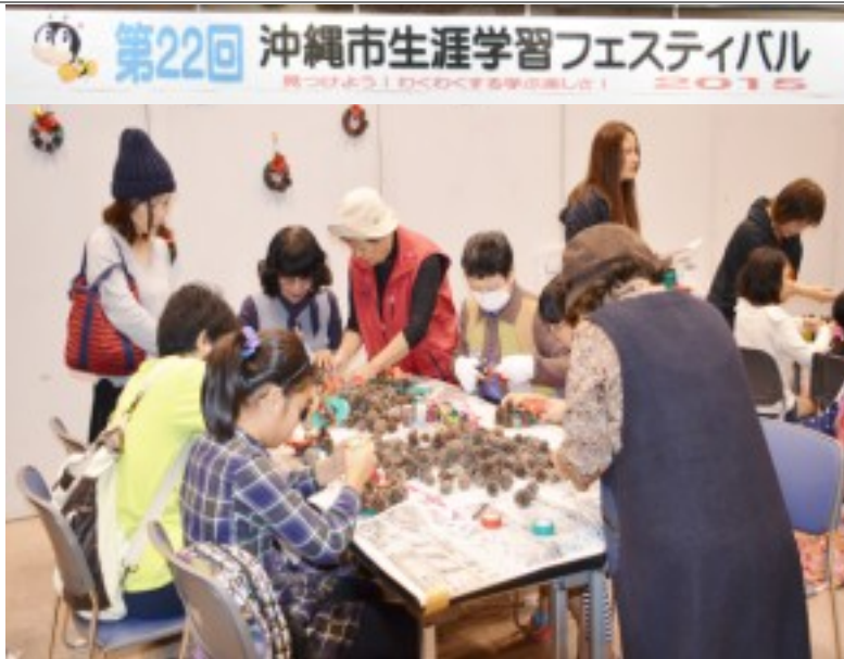
松ぼっくりでクリスマスリースを作るブースには今年も多くの家族連れで賑わった

10年連続参加の「センター手工芸同好会」のブースには、松ぼっくりを使ってのクリスマスリースづくりに親子が楽しそうに挑戦していた。