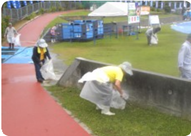
小雨降る中、ひとつのゴミも逃すまいと清掃作業に励むボランティア参加者